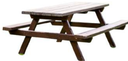
Une table à pique-nique