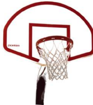
Un panier de basketball