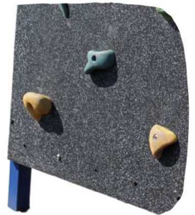
Des prises d'escalade