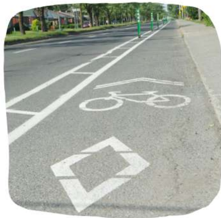
Une piste cyclable