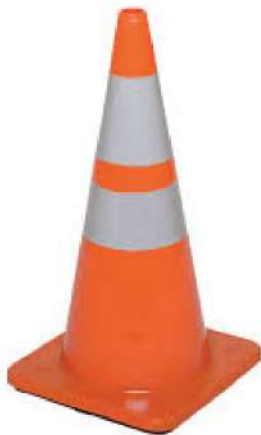
Un cône orange