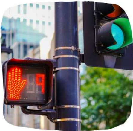
Un feu pour piéton