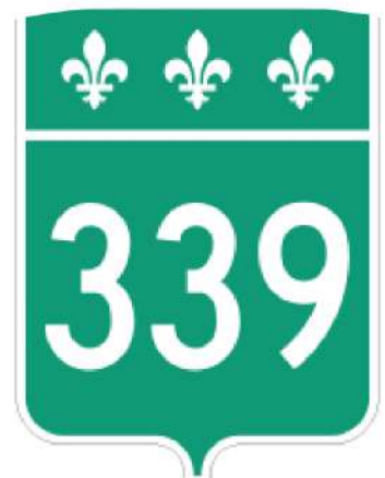
Un numéro de route