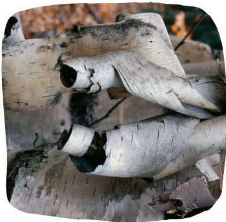
De l'écorce de bouleau à papier