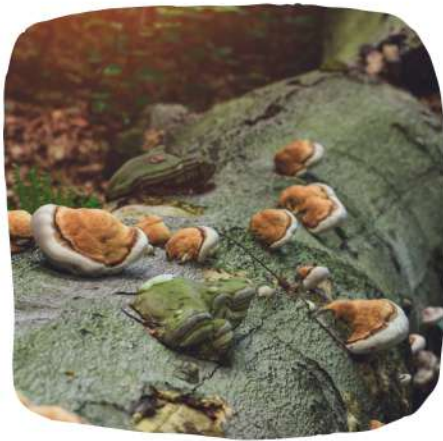
Des champignons sur un tronc