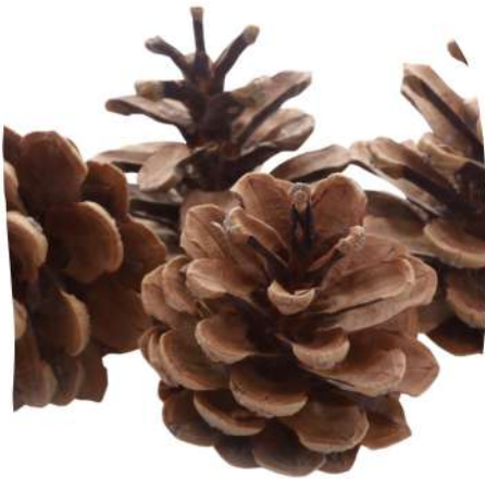
Un cône ou cocotte