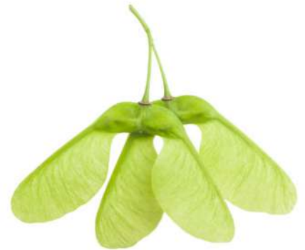
Des samares d'érable