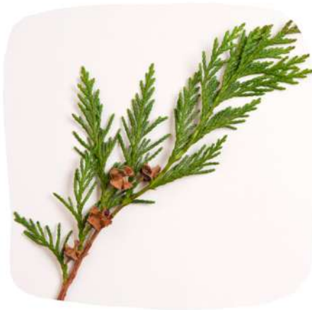
Une branche de cèdre