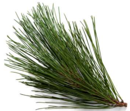
Des aiguilles de pin