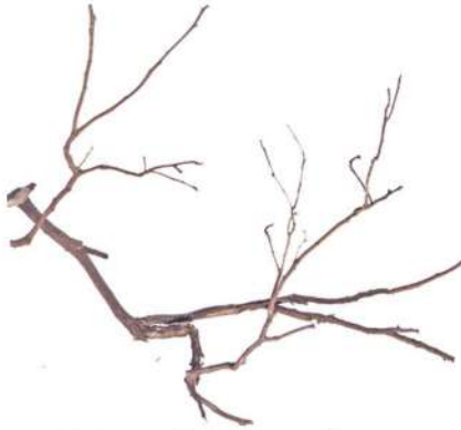
Une branche sans feuilles