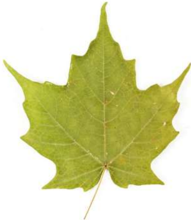
Une feuille d'érable