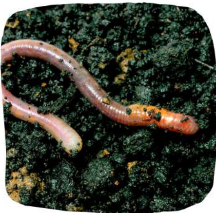
Un ver de terre