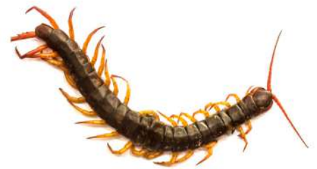
Un cent-pattes ou centipède