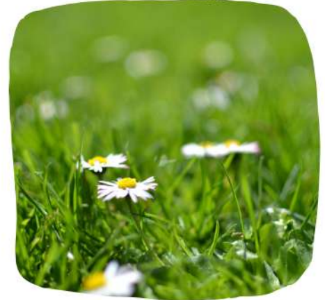
Une fleur bleue ou blanche