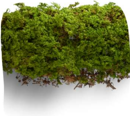
De la mousse