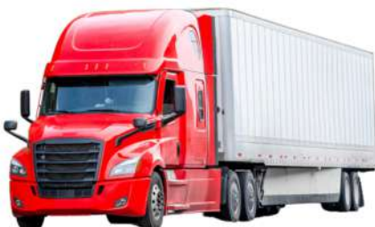
Un camion lourd