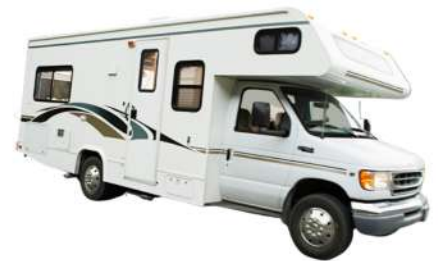
Un véhicule de plaisance (roulotte)