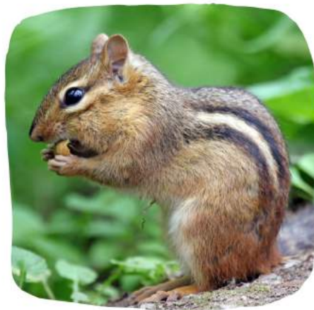
Un tamia rayé