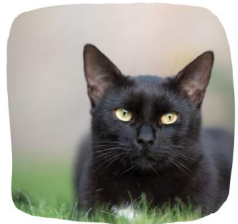
Un chat noir