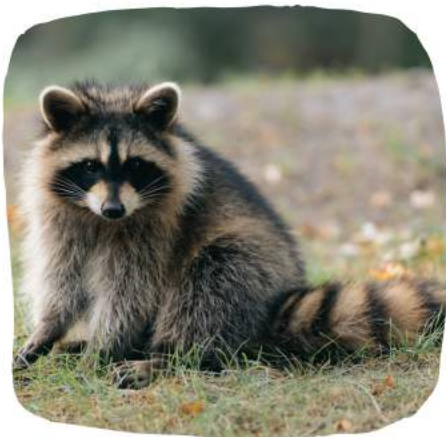
Un raton laveur