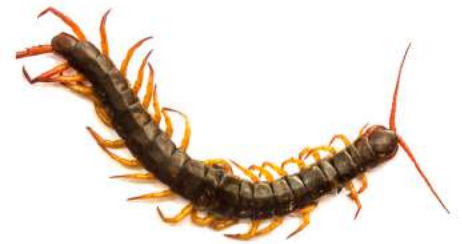
Un cent-pattes ou centipède