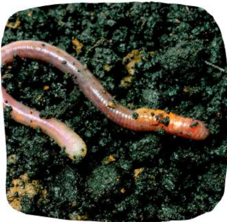
Un ver de terre