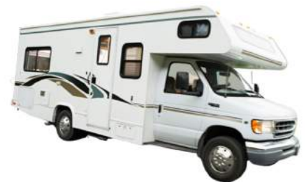
Un véhicule de plaisance (roulotte)