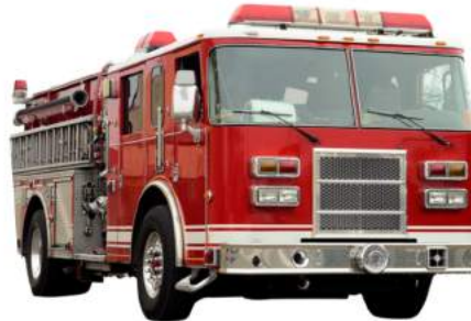
Un camion d'incendie