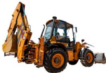
Un véhicule de construction