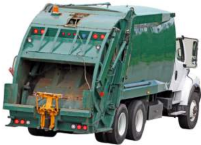
Un camion à ordures