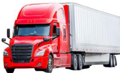
Un camion lourd