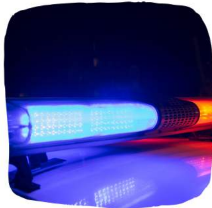
Une véhicule d'urgence (police ou ambulance)